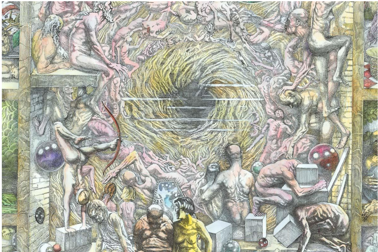
Johannes Høie, Utsnitt av midtpanel, "Triptykon".

Utstillingen «Myriader» i Sal 1 viser tegning og grafikk av Louis Moe og Johannes Høie.