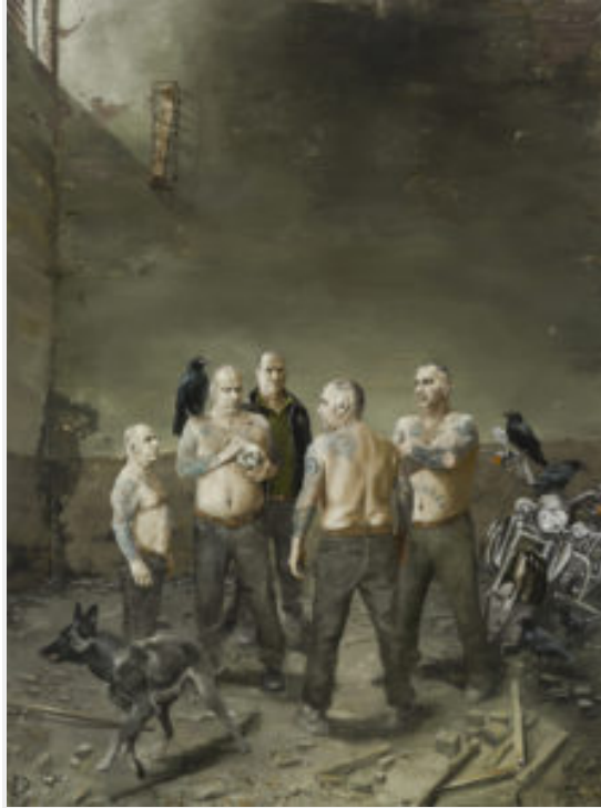
Jarmo Mäkilä: Bandidos, 2019. oljemålning, 203 x 151 cm.

I utställningen Nordic Noir iscensätts ett tidsöverskridande möte mellan sex finländska och norska konstnärer. Gäster hos Akseli Gallen-Kallela är Sverre Malling (f. 1977), Louis Moe (1857–1945), Jarmo Mäkilä (f. 1952), Odd Nerdrum (f. 1944) och Hugo Simberg (1873–1917).