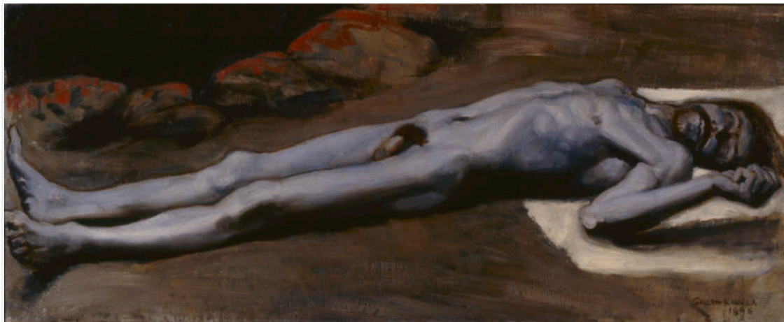
Akseli Gallen-Kallela: Den döde Lemminkäinen, 1896. Ölja på duk, 35x85cm. Gallen-Kallela Museet.

I samband med utställningen publiceras FD Juha-Heikki Tihinens artikel Tummaa ja tummempaa – synkät sisarukset . ("mörkt och mörkare – dystra syskon.").