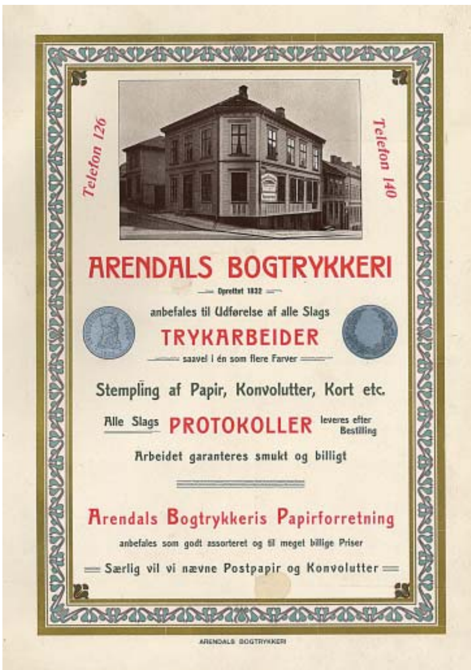
Annonseplakat for Arendals Bogtrykkeri. Trykkeriets gård på hjørnet av Østregate og Hylleveien i Arendal står fremdeles.