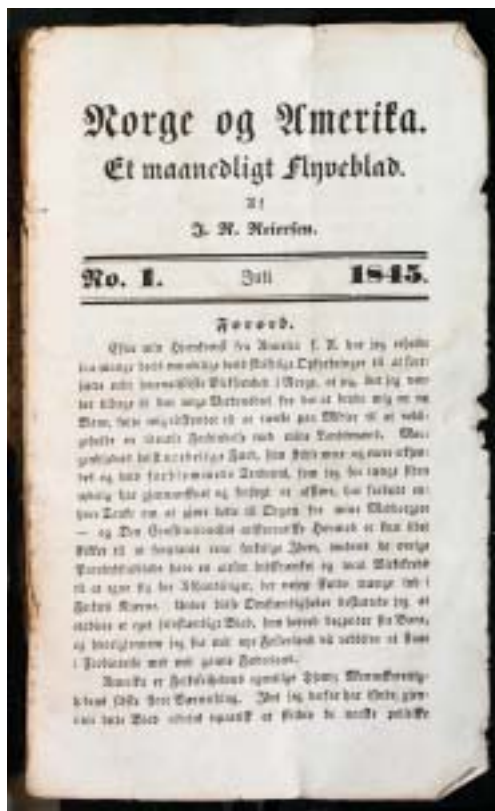
Norge og Amerika nr 1 juli 1845.

ved etableringen av byens bibliotek i 1832 bærer mange vitnesbyrd om dette.